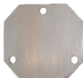
1367 / 1368