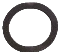
1688 / 1687